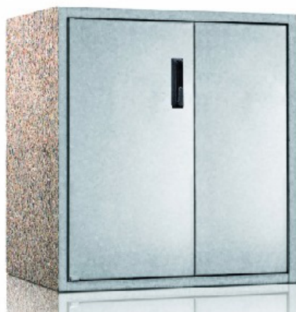
Dimensions armoire de commande (mm)